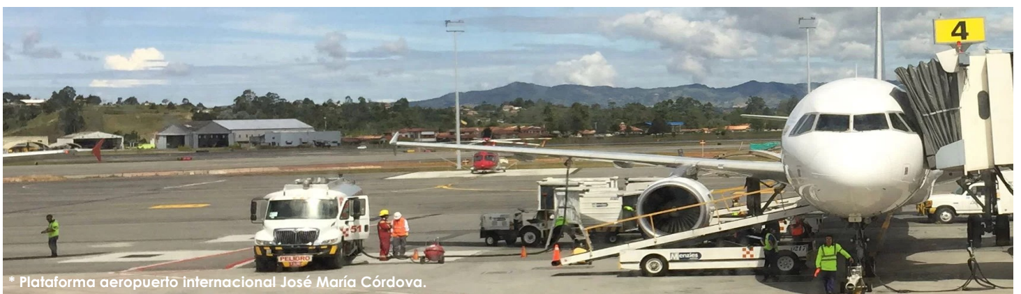
* Plataforma aeropuerto internacional José María Córdova.

SI IDENTIFICAS, DURANTE EL ABASTECIMIENTO DE COMBUSTIBLE, UNA CONDICIÓN QUE AFECTE LA SEGURIDAD OPERACIONAL RECUERDA REPORTARLO AL SMS DEL AEROPUERTO.